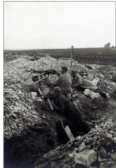
# Artois, mai 1915 Deuxième bataille d'Artois